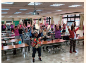
107年度社區銀髮族健康人生及樂活學習班