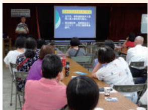
新北市山坡地輔導農民農地水土保持處理與維護講座