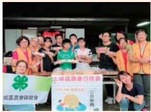
家政回饋服務暨四健公共服務活動做中秋月餅轉交華山基金會關懷轄內獨居老人