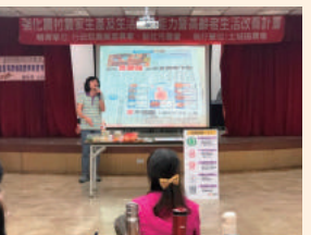
辦理強化農村農家生產及生活經營能力暨高齡者生活改善計畫—農村特派員進階訓練