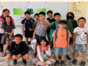
四健會員日—四健fun疊杯活動