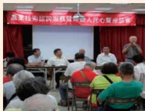
農業技術諮詢及傾聽人民心聲座談會