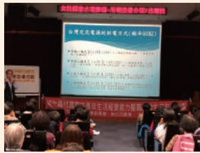
性別意識培力工作坊—居家水電修繕系列講座