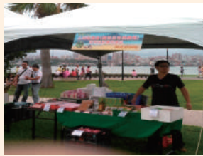
新北市107年度文旦柚整合行銷展售會