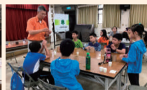
四健會員日—田園老師的魔法科學活動