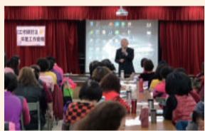
家政班長、義指研習暨年度工作會報