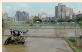
水稻共同作業—代耕作業情形