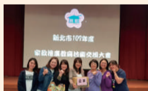
家政推廣教育技術交換大會