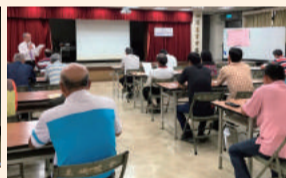
農事技術研究班幹部會議