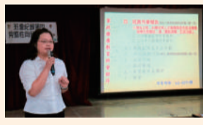
家政班書記工作研討會