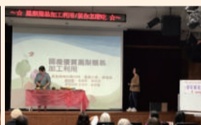
鳳梨及香蕉消費地教育講習