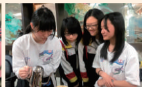
四健咖啡作業飄香組