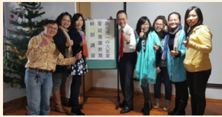
參加「新北市106年度家政推廣教育幹部講習」