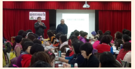
家政幹部研習暨年度工作會報