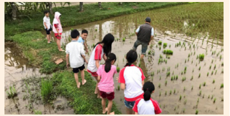
四健你知「稻」嗎作業組