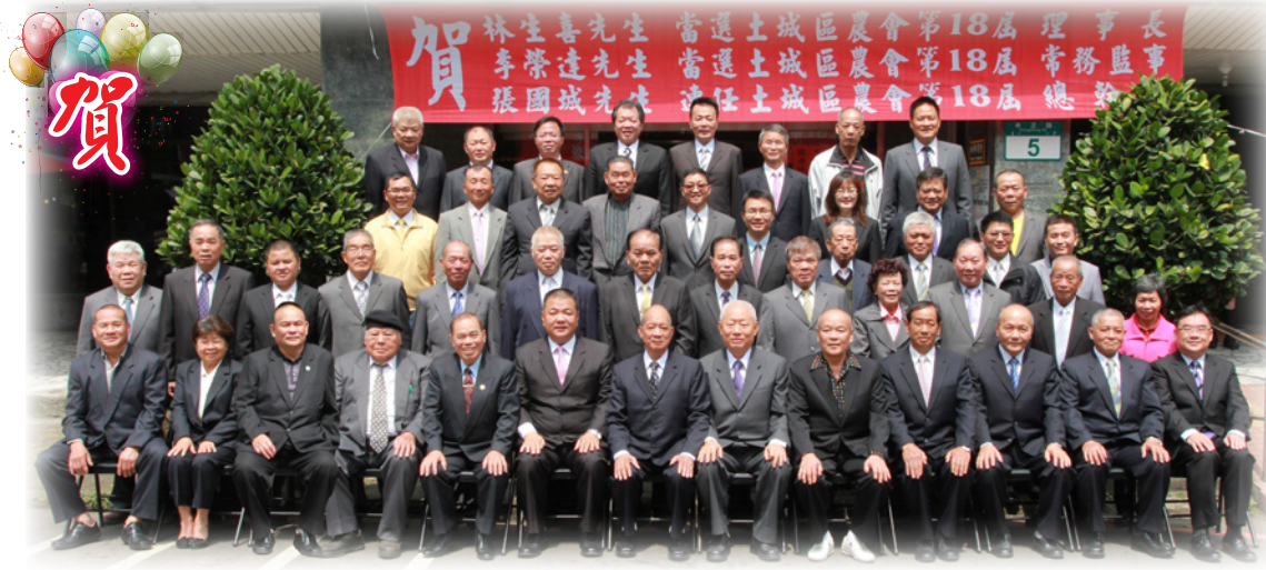
土城區農會第18屆選任人員名單