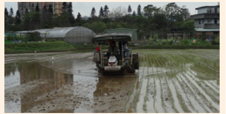
水稻共同作業一代耕作業情形