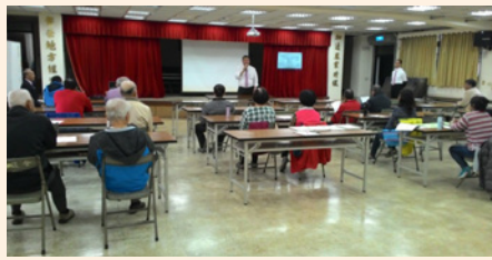
農事技術研究班幹部會議