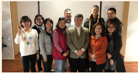
參加「新北市106年度四健推廣教育義務指導員暨會員研習會」