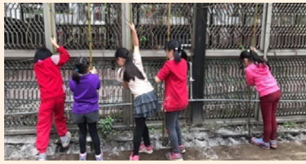
四健「花生」什麼事作業組