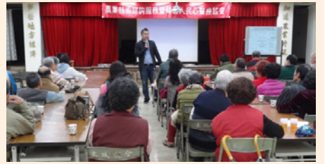
傾聽人民心聲座談會暨農業技術諮詢服務