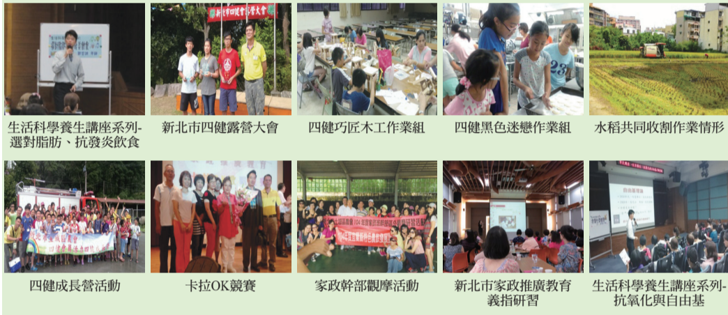
生活科學養生講座系列-選對脂肪、抗發炎飲食 新北市四健露營大會 四健巧匠木工作業組 四健黑色迷戀作業組 水稻共同收割作業情形 四健成長營活動 卡拉OK競賽 家政幹部觀摩活動 新北市家政推廣教育義指研習 生活科學養生講座系列-抗氧化與自由基