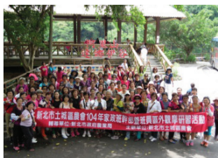
達娜伊谷生態園區